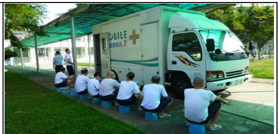
肺結核傳染病預防