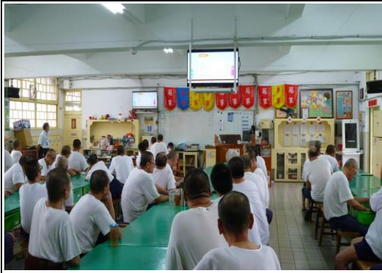
專業衛教精彩演講