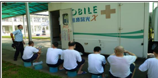
定期入監胸部X光篩