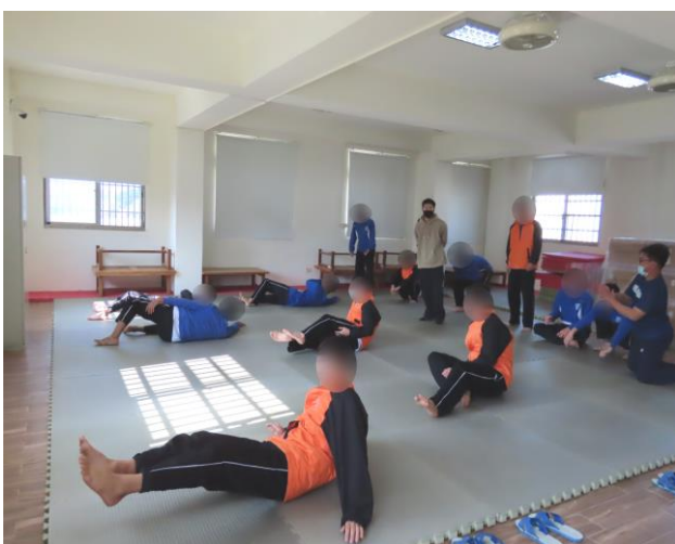
▲教導少年護身安全倒法

1月26日9時至16時，與國立臺南大學合作由陳、曾二位老師帶領少年進行體育及品德教育營活動，透過體育課程解說體育精神及探討社會案例、教導情緒管理原則、人際互動技巧及護身安全倒法教學，計有少年18人參加。