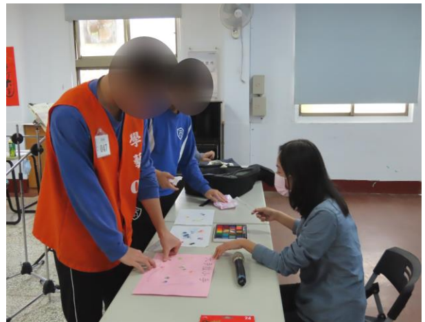
▲薛老師手作創意繪畫指導