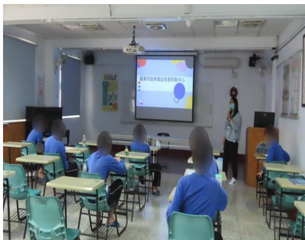
▲毒品危害防治反毒宣導

1月12日14時至15時，由臺南市政府毒品危害防制中心胡個管師及傅個管師、李個管師入所進行該中心業務服務說明；內容為新興毒品反毒宣導、戒癮資源、相關資源轉介說明，計有少年21人次參加。