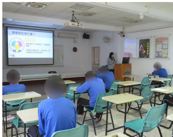
▲毒防中心業務服務說明