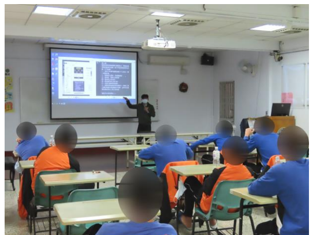
▲強化少年法治觀念