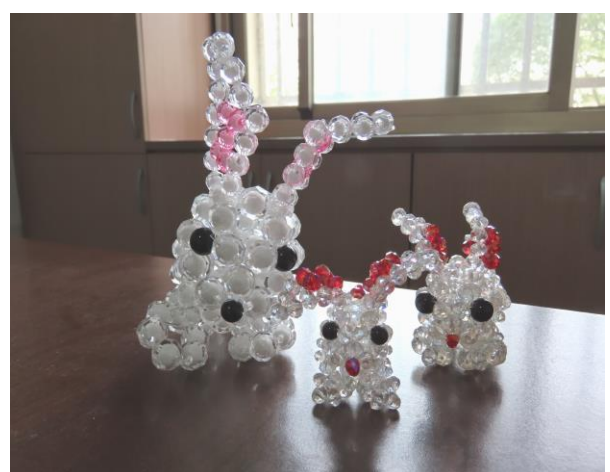
▲少年手工串珠成品