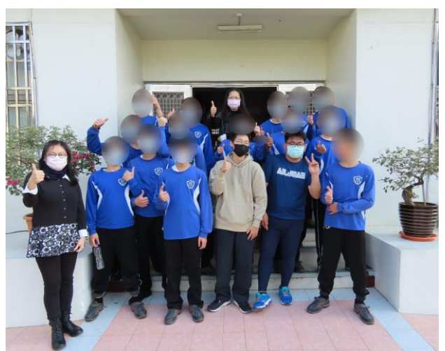
▲體育及品德教育營活動合照