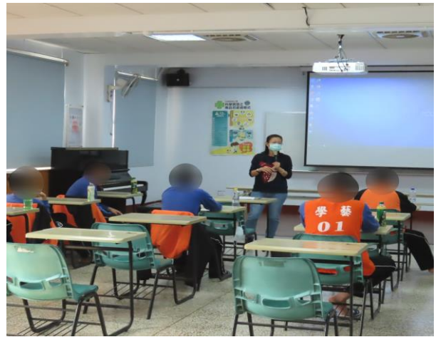
▲與少年討論家庭議題