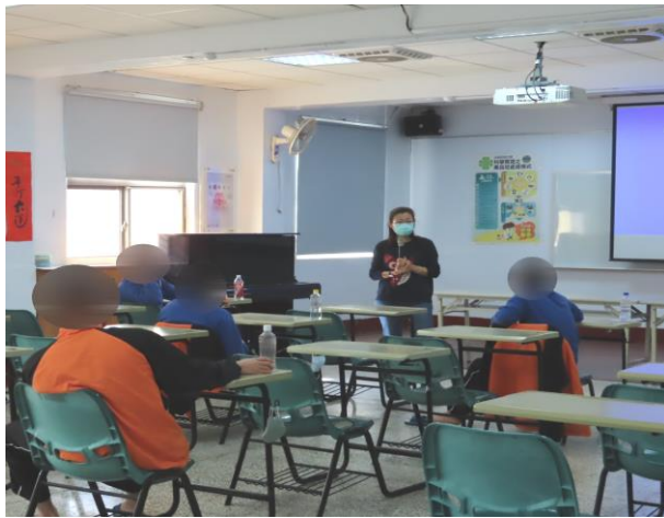
▲黃社工師增能團體課程

1月2日、9日、16日、23日、30日9時至11時，與臺南市立醫院合作辦理「科學實證之毒品犯處遇模式計畫」—進行增能團體課程，邀請黃社工師入所授課，內容為目的VS代價、人生的分數、我的家庭等人生重大事件回顧等主題討論，計有少年98人次參加。