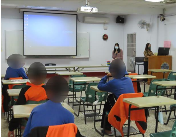
▲就業中心業務服務說明

1月25日14時至15時，邀請就業服務中心陳、林二位就業服務員分別進行就業服務宣導，提供該中心業務服務說明以及建立正確價值觀、職業興趣探索等宣導，計有少年19人次參加。