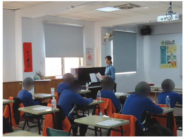
▲基礎鋼琴彈奏教學