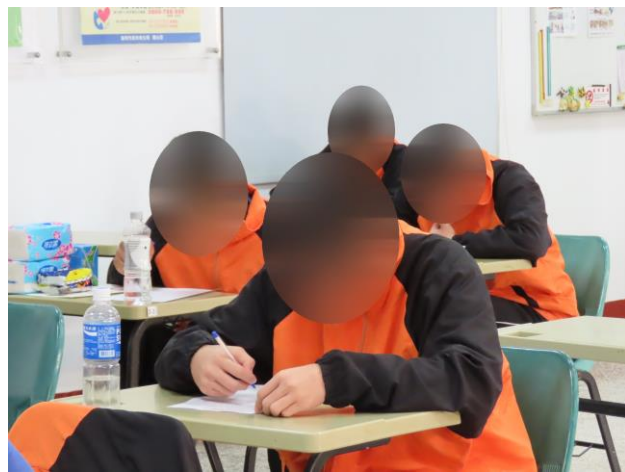
▲少年認真作答試題