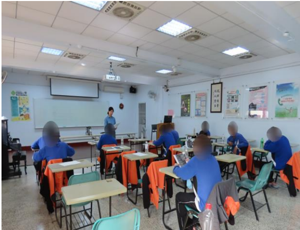
▲邱老師基本樂理教學

1月8日、15日、22日、29日9時至11時，由功學社邱專業指導老師教導少年基本樂理、歌曲介紹、歌詞意涵與歌唱方式、基礎鋼琴彈奏教學，讓少年學習基礎樂理認識，本月計有少年83人次參加。