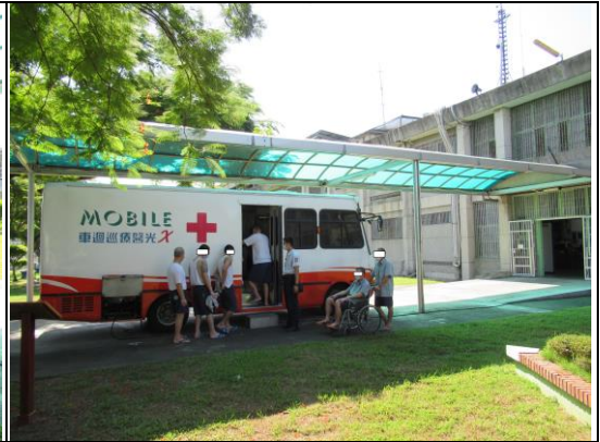
肺結核傳染病預防