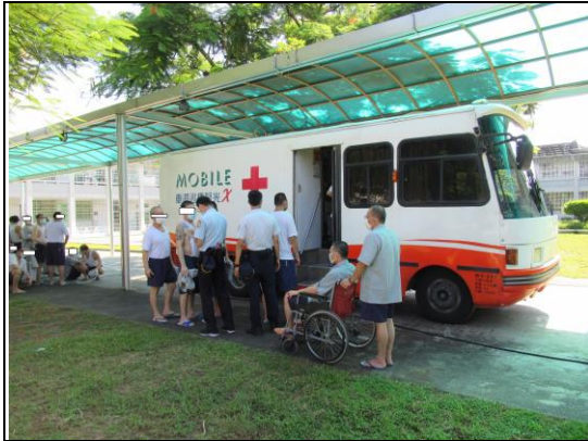
定期入監胸部 X 光篩