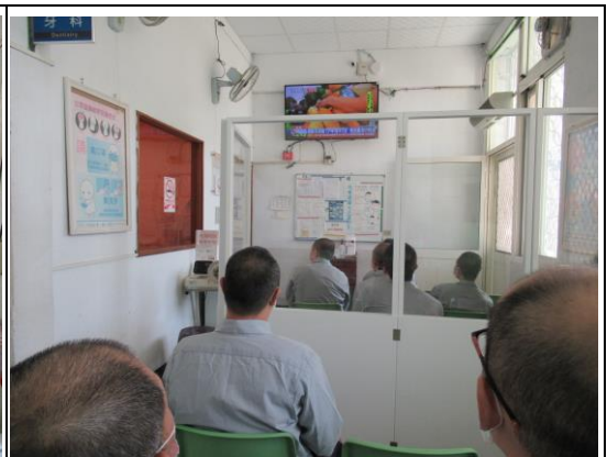
各類醫療資訊題材