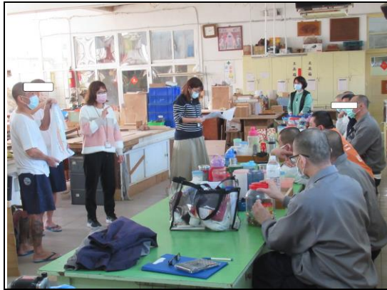
專業衛教精彩演講