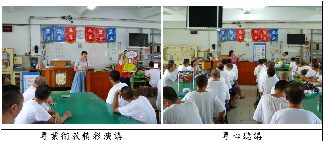
專業衛教精彩演講