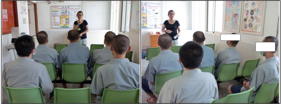
(1 場，共計 4 人)