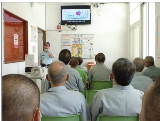
精彩衛教 vcd 宣導