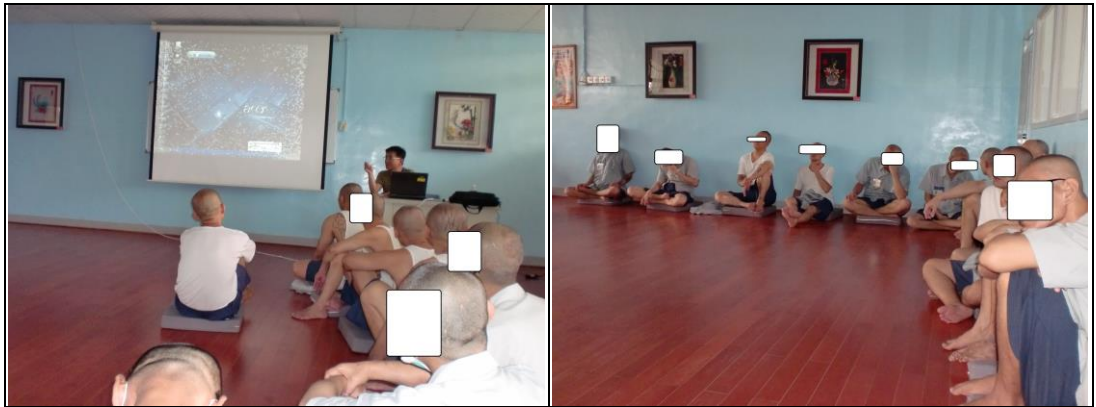
(1 場，共計 19 人)