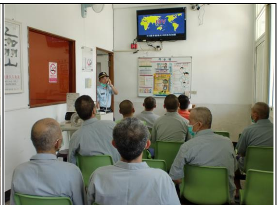
各類醫療資訊題材