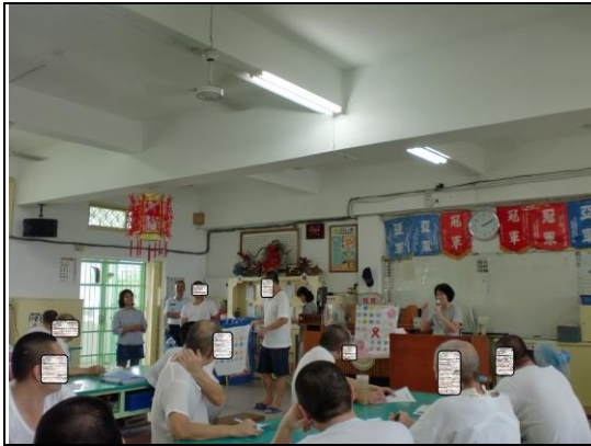
專業衛教精彩演講