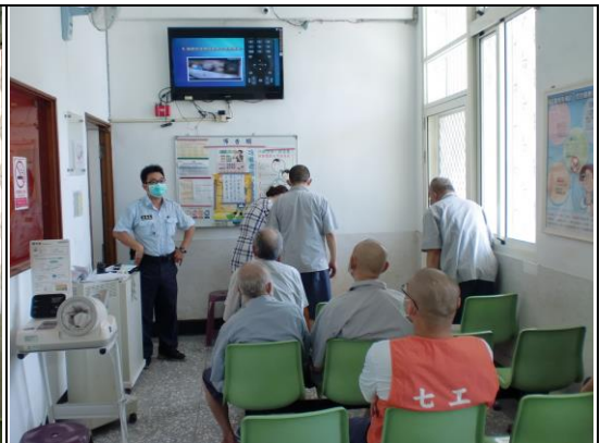
各類醫療資訊題材