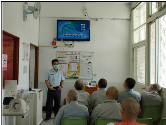
精彩衛教 vcd 宣導