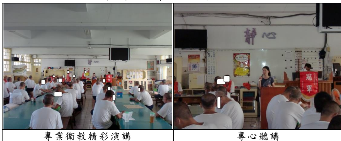
專業衛教精彩演講